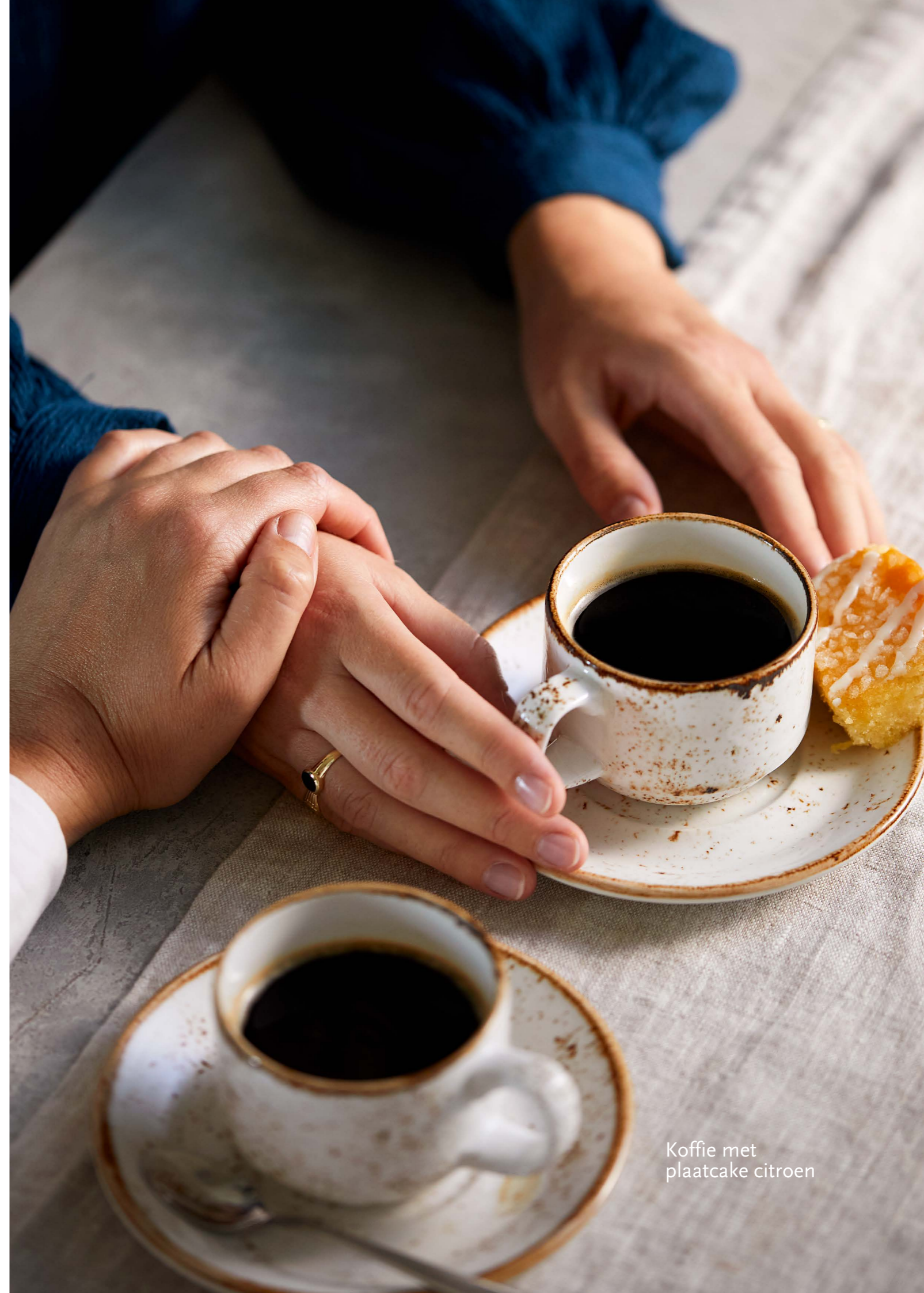
Koffie met plaatcake citroen

Wij hebben deze brochure met veel zorg gemaakt. Ondanks dat, kan het zijn dat er een product in staat dat (tijdelijk) niet leverbaar is of dat er iets in staat dat intussen anders is dan op het moment van drukken. U kunt dan ook geen rechten ontleen aan de inhoud van deze brochure.