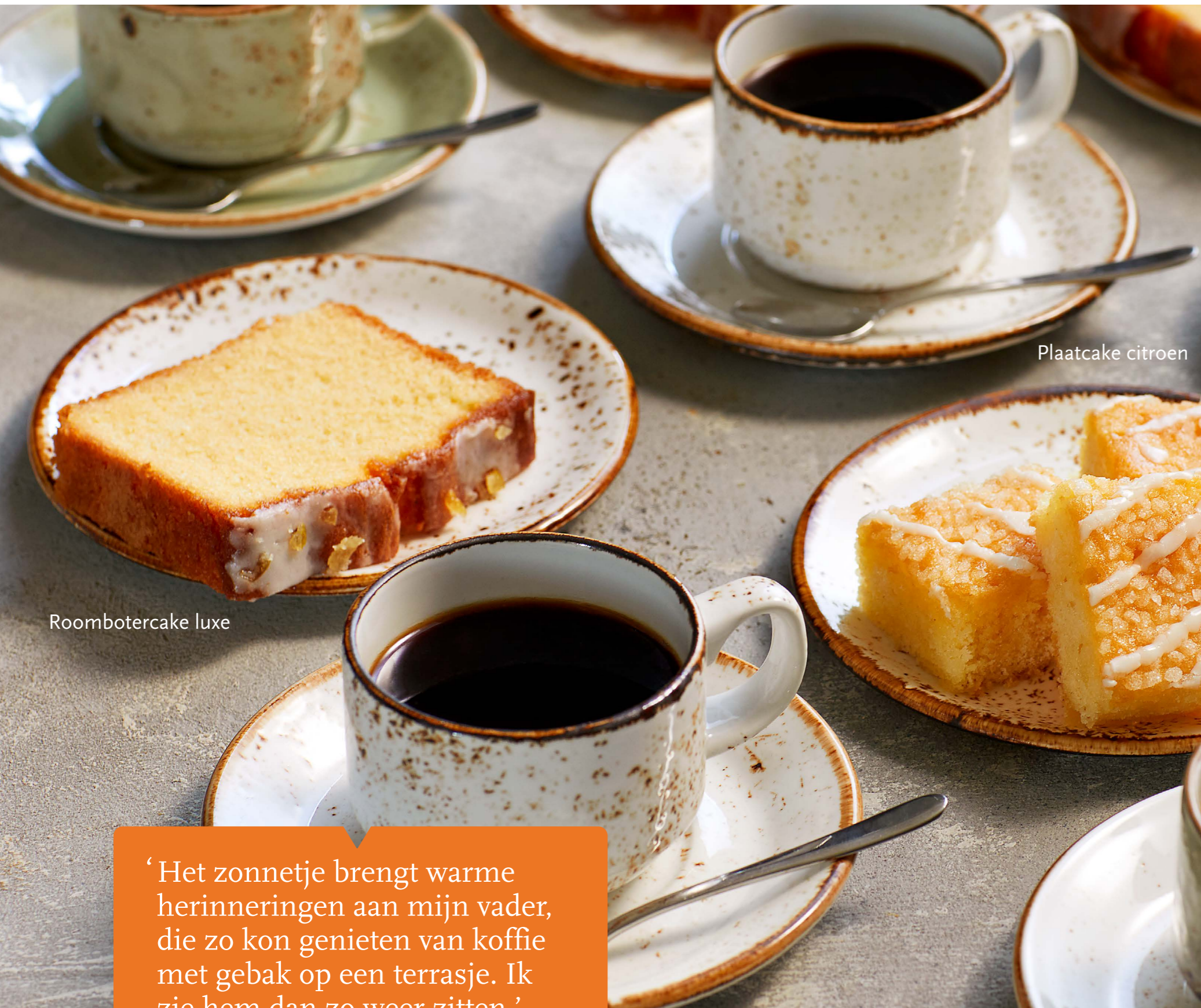
Roomboter cake luxe