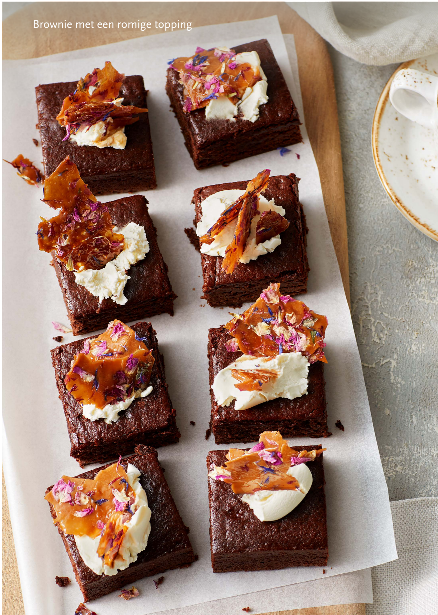
Brownie met een romige topping